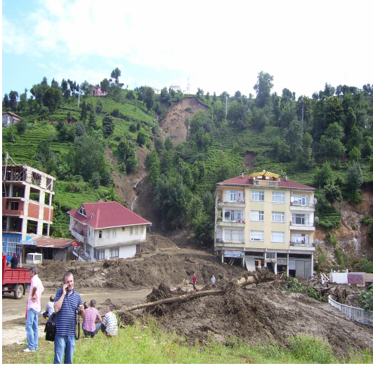
Dere ağzına yapılan konut (180° ters dönmüş)