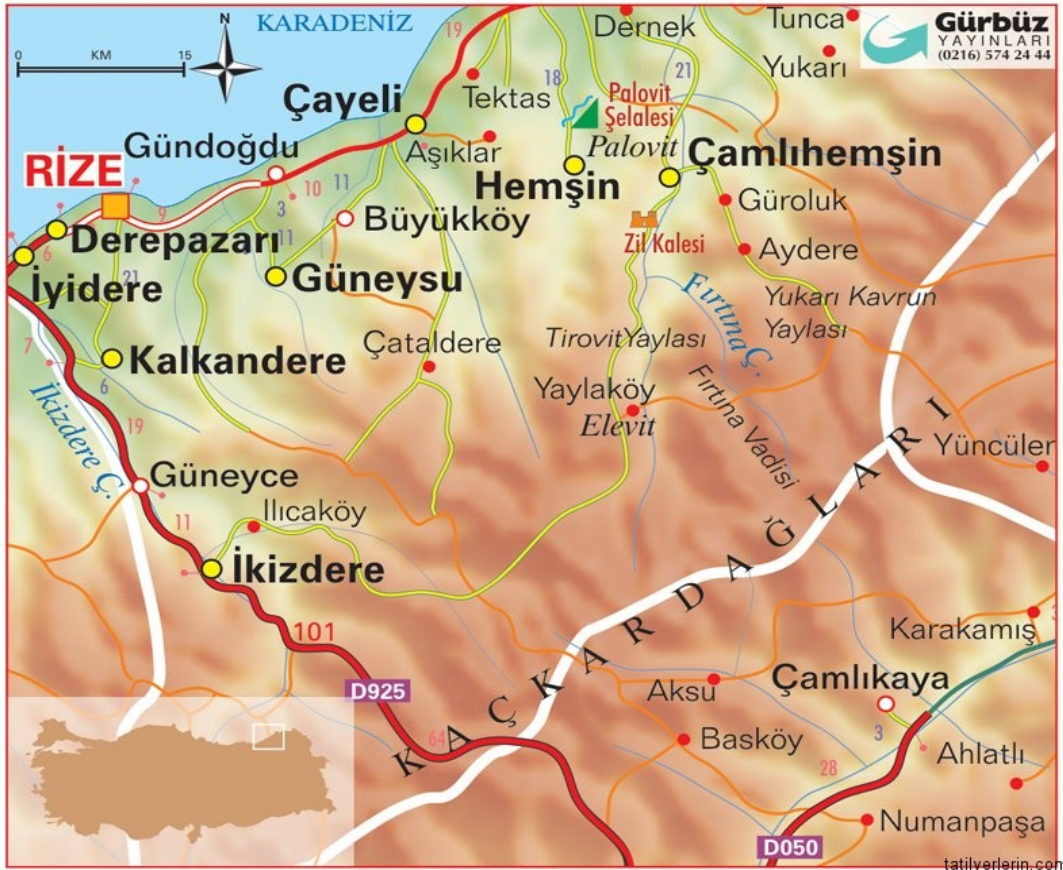
Şekil 1- Bölgenin Coğrafi Haritası

26-27 Ağustos 2010 tarihleriinde yaşanan heyelan ve sel baskını sonucunda can ve mal kayıplarının yoğun olarak yaşandığı Gündoğdu Beldesi; Rize il merkezinin doğusunda İl merkezine yaklaşık 5-6 km. mesafede, dar bir kıyı şeridine paralel olarak gelişmiş, güney kısmı topografik olarak oldukça dik eğimli bir şekilde yükselerek devam eden ve doğu Karadeniz dağları ile bu dağların üzerinde parçalanma sonucu oluşmuş çok sayıda dere ve çay yataklarının oluşturduğu küçük aluviyal düzlükler ve vadi yamaçları ile küçük dere yatakları üzerine kurulmuştur. Belde 4-5 km. uzunluğunda dar bir şerit şeklinde uzanmakta olup, 5 mahalle ve 14 köyden oluşmaktadır.(Şekil-1)