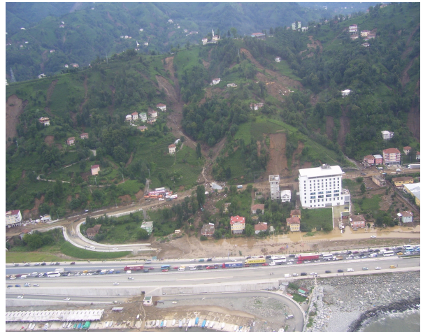
Karadeniz otoyolunun oluşturduğu sedde

Selin etkin olduğu ve can kayıplarına neden olduğu bölgelere bakıldığında; yerleşim alanlarında yer alan yapıların genellikle vadi kenarlarında yer alan küçük alüviyal düzlüklere kurulduğu, bazı kuru dere yataklarının da yapılaşma amacıyla kullanıldığı tespit edilmiştir. Ayrıca eski kıyı çizgisinde yer alan yapılar ile denizin doldurulması sonucu oluşan alanların yerleşime açılması ve bu yerleşim alanları ile deniz arasında yapılan Karadeniz Otoyolunda yüzeysel drenaja yeteri kadar imkan tanıyan sanat yapıların (köprü, menfez, açık drenaj kanal ve barbakanların) yapılmamasından dolayı karayolu; deniz ile yol gerisinde yer alan yapılar arasında sedde görevi görmesine neden olmuş, bu durumda (çay fabrikasının bulunduğu alanlarda) sel sularının 6-7 m. yükselmesine neden olmuştur.