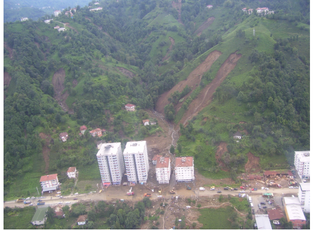
Vadi ağzlarını kapatan konutlar